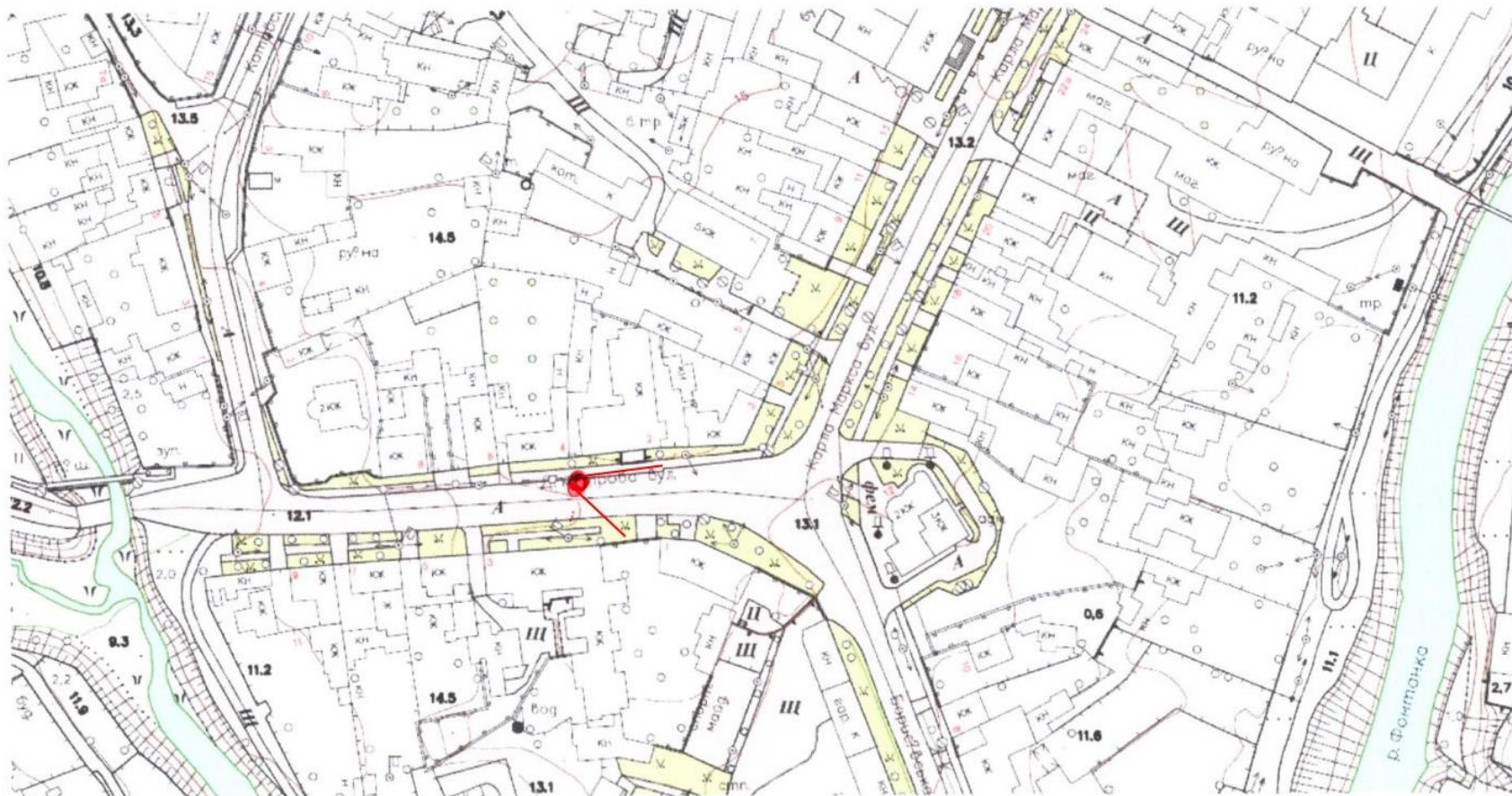
Схема розміщення камер відеоспостереження в м.Татарбунари на розі вулиць Центральна та Івана Кожедуба