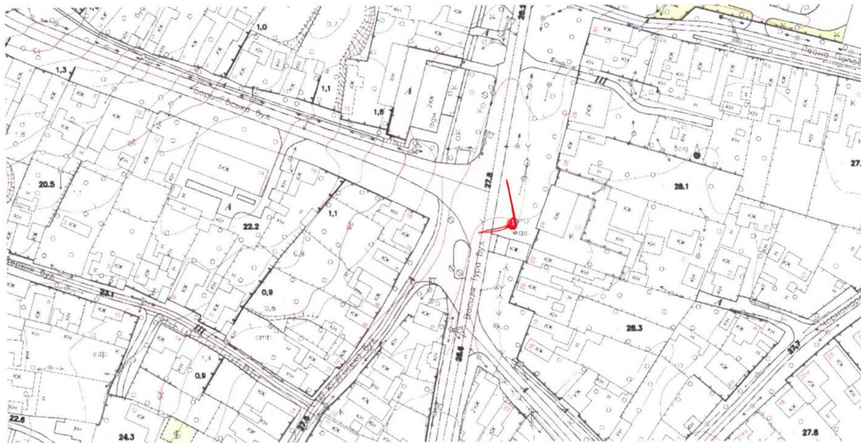
Схема розміщення камер відеоспостереження в м.Татарбунари на розі вулиць Василя Тура та Борисівська