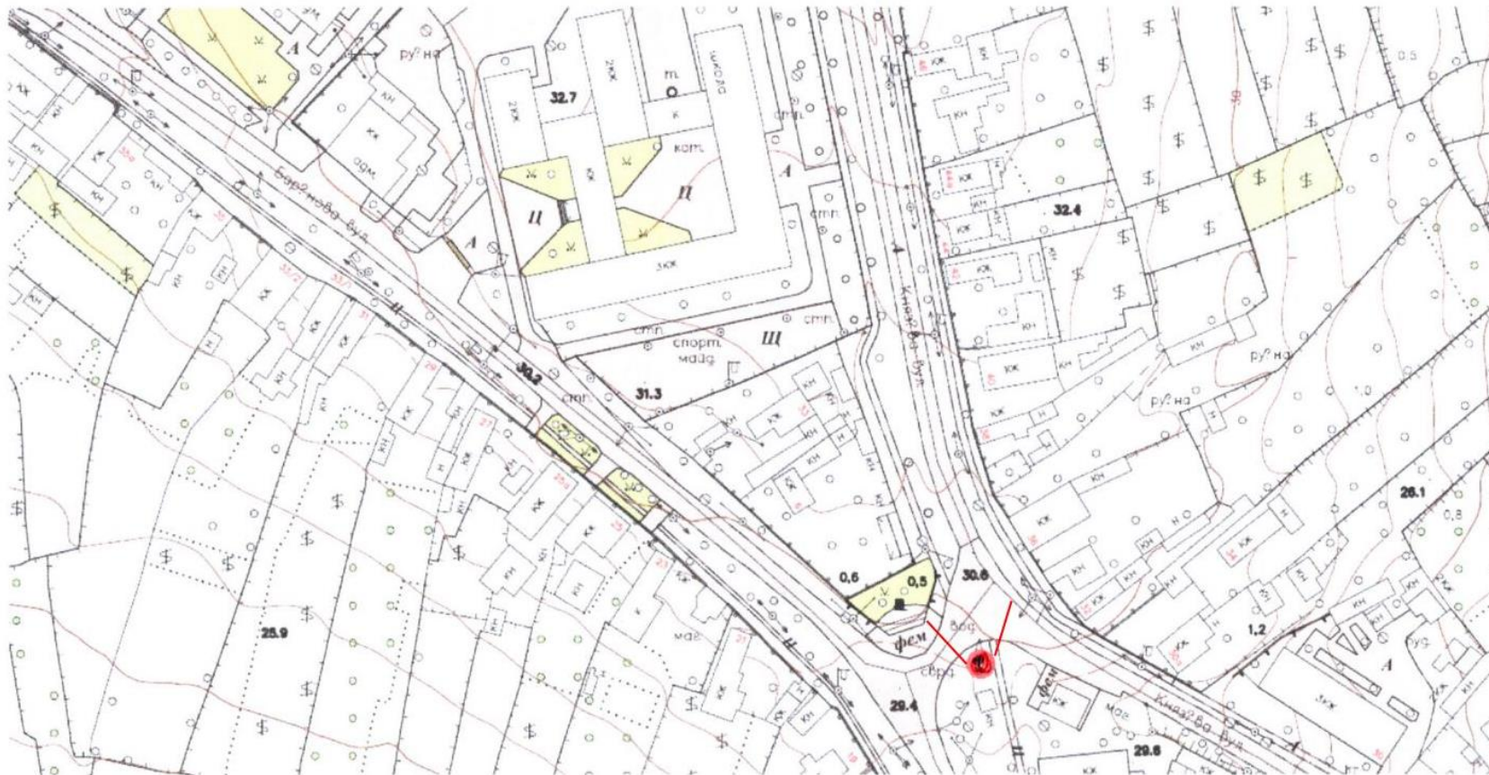
Схема розміщення камер відеоспостереження в м.Татарбунари на розі вулиць Барінова та Князева