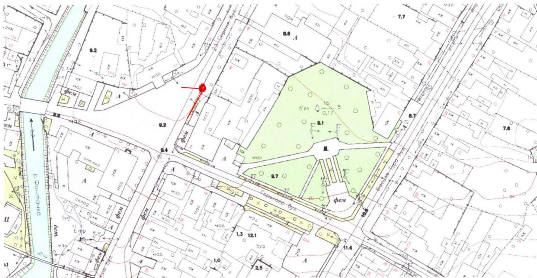
Схема розміщення камер відеоспостереження в м.Татарбунари на розі вулиць Горького та 23 серпня

ЗАТВЕРДЖЕНО Рішення виконавчого комітету Татарбунарської міської ради 28.06.2023 №__